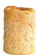
PANCAN(多国語) ストロベリー味 賞味期限 37 ヶ月