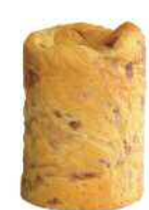
PANCAN(多国語) ブルーベリー味 賞味期限 37 ヶ月