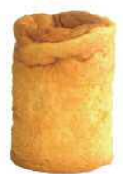
PANCAN(多国語) オレンジ味 賞味期限 37 ヶ月